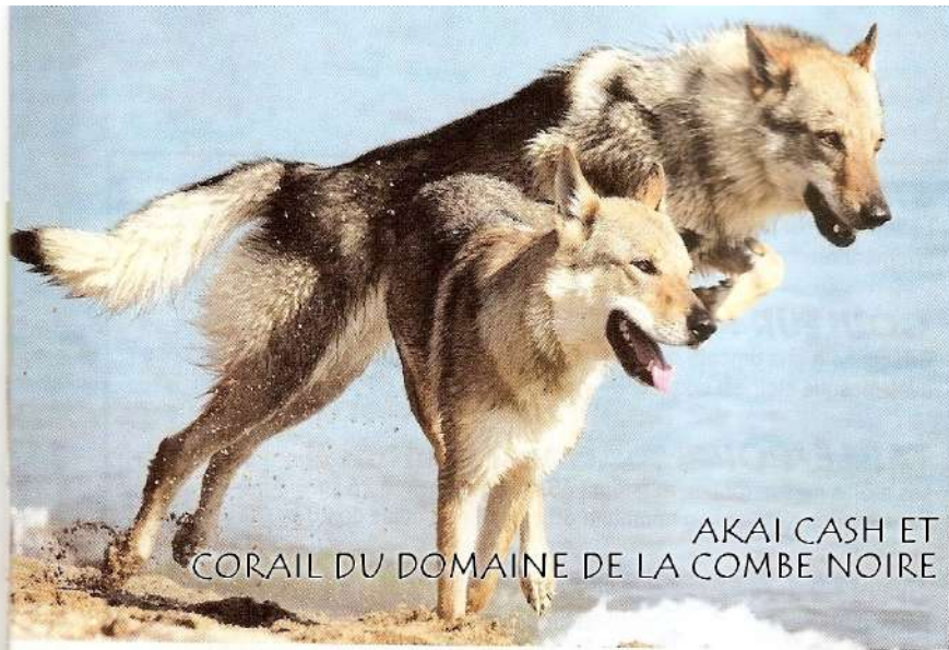
AKAI CASH ET CORAIL DU DOMAINE DE LA COMBE NOIRE