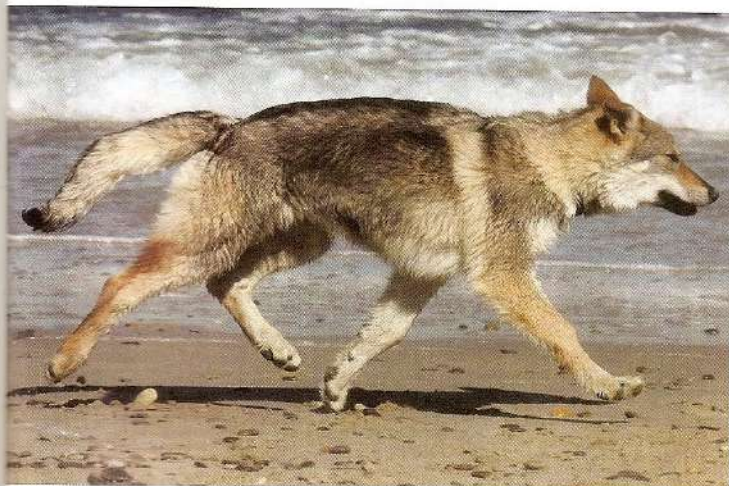
CHRISTEL COSTANZO CHRISTEL COSTANZO