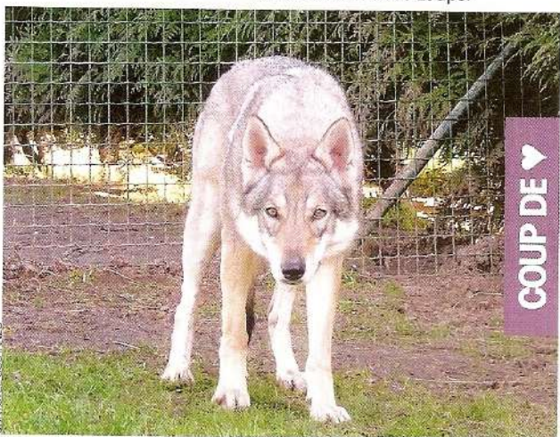
Akira de l'Âme des Loups.